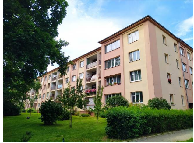
Obrázek 11.3: Sídliště Solidarita, postavené na konci 40. let 20. století.