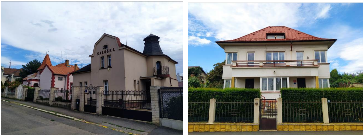
Obrázek 11.1: Vilová čtvrť Strašnice.