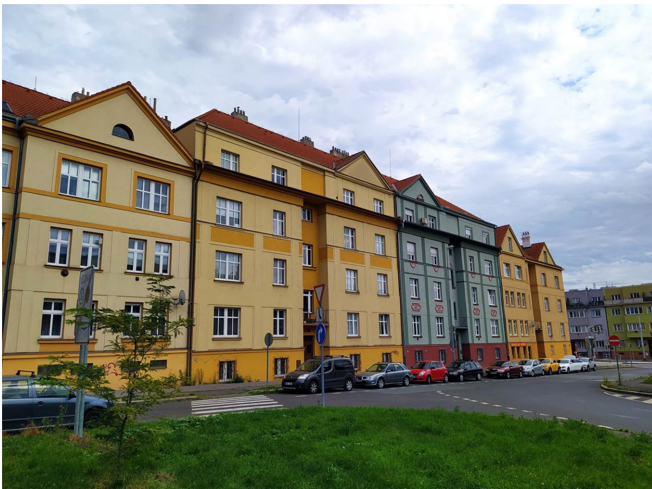
Obrázek 11.2: Družstevní domy v ulici Pod Rapidem, postavené na začátku 20. let 20. století.