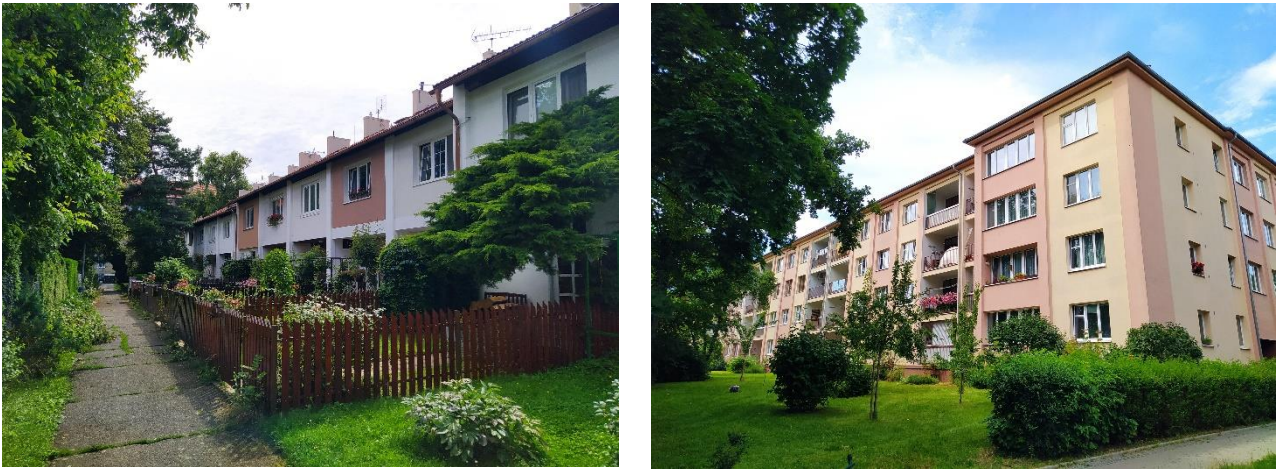
Figure 11.3: Solidarita housing estate, built in the late 1940s.

The character of the district is therefore influenced mainly by the expansion of the district in the pre-war period in response to the development of Prague and by socialist urban planning in the post-war period. After 1989, larger residential projects were no longer built and only vacant areas within the existing development were developed (e.g., residential projects such as Gutovka or Vinice). Several larger buildings with non-residential functions were also built (e.g., a Tesco department store and the Czech Statistical Office near the Skalka metro station and Radio Free Europe near the Želivského metro station).