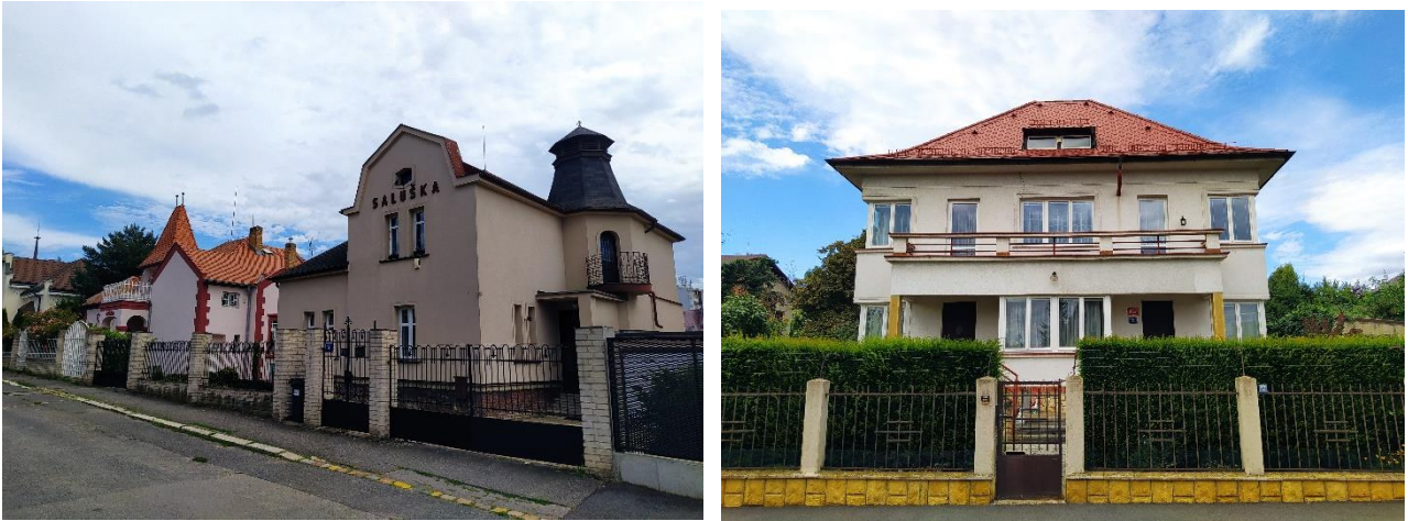
Figure 11.1: Villa quarter in Strašnice.