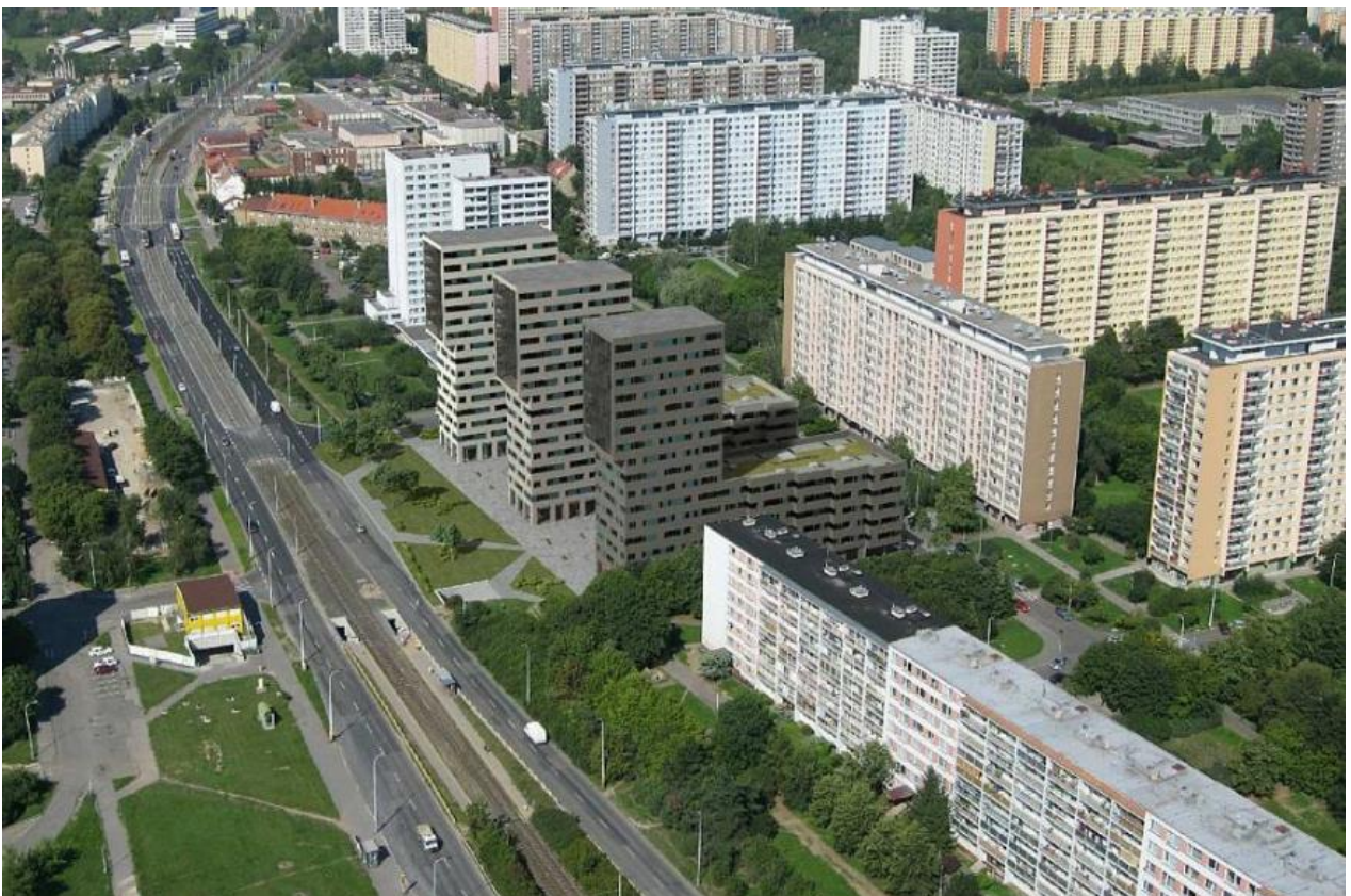
Figure 12.3: One of the alternatives of the planned CPI construction project in the Ďáblice housing estate.