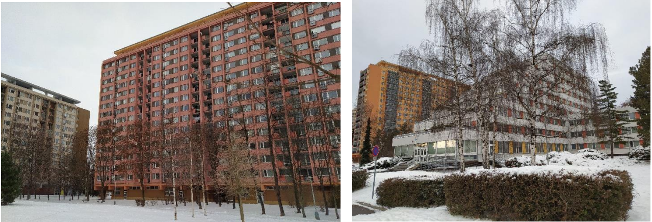
Figure 12.2: Ďáblice housing estate—large prefabricated houses and terraced family houses. Photo: Petra Špačková (2021).

(Řepková, 2019). For its architectural and urban design qualities, the housing estate was already highly rated in the 1970s and had a similar status to the Lesná housing estate in Brno (Švácha, 2019).