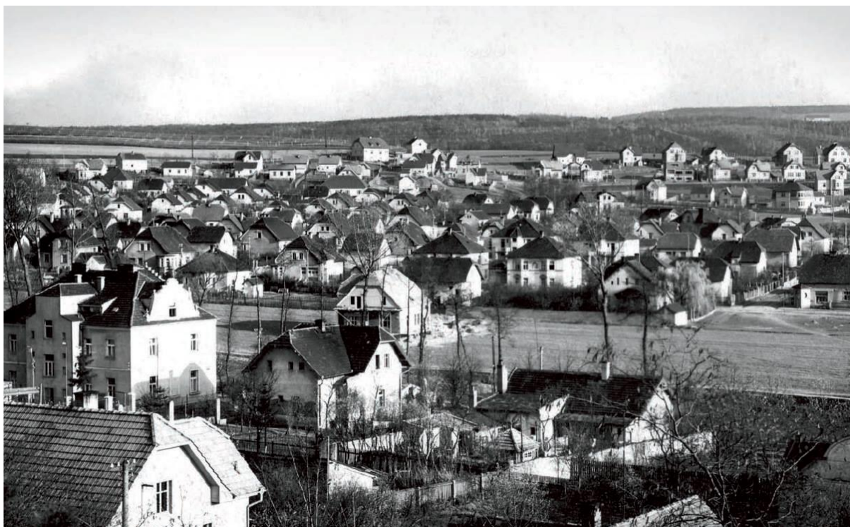
Obrázek 16.2: Čechova čtvrť 1930. Typická ukázka meziválečné výstavby.