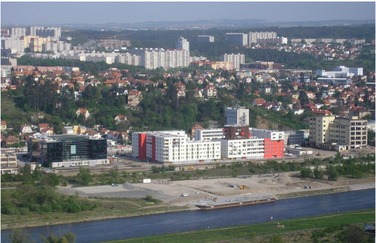
Obrázek 16.3: Modřany na počátku nového tisíciletí. Pobřežní průmyslový pás se postupně transformuje na rezidenční funkci, za ním následuje oblast meziválečných vilových čtvrtí a na horizontu panelová sídliště z 80. let.

V Modřanech se v průběhu 150 let vytvořila zřetelná urbánní struktura (viz hlavní mapa). Její kontury vykrytalizovaly nejsilněji na konci 80. let. Byla tvořena historickým jádrem s obytně-obslužnými funkcemi, kde každá vývojová fáze zanechala své stopy. Ještě v 60. letech 20. století zde byly viditelné prvky spojené s původními zemědělskými funkcemi. Na toto centrum navazoval pás území při Vltavě s industriální funkcí. Směrem na sever až k hranici s Hodkovičkami se nacházelo množství menších i větších podniků, na jih v těsné návaznosti na centrální část území historického cukrovaru. Další industriální oblast je lokalizována na jihu při hranici s Komořany (Modřanské strojírna, Interpharma). Dalším prvkem urbánní struktury jsou území zastavěná rodinnými domky (povětšinou z meziválečného období), která víceméně z jihu, východu a severu obepínají centrální část. Konečně posledním prvkem je oblast sídlišť z osmdesátých let, která je nejdále od Vltavy a zabírá v současnosti největší část katastrálního území Modřan. V posledních dvaceti letech však dochází v industriálních oblastech k poměrně významným změnám. Řada i významných podniků zde zrušila své výrobní aktivity nebo přímo zanikla a na jejich místech vyrůstají komplexy obytných budov.