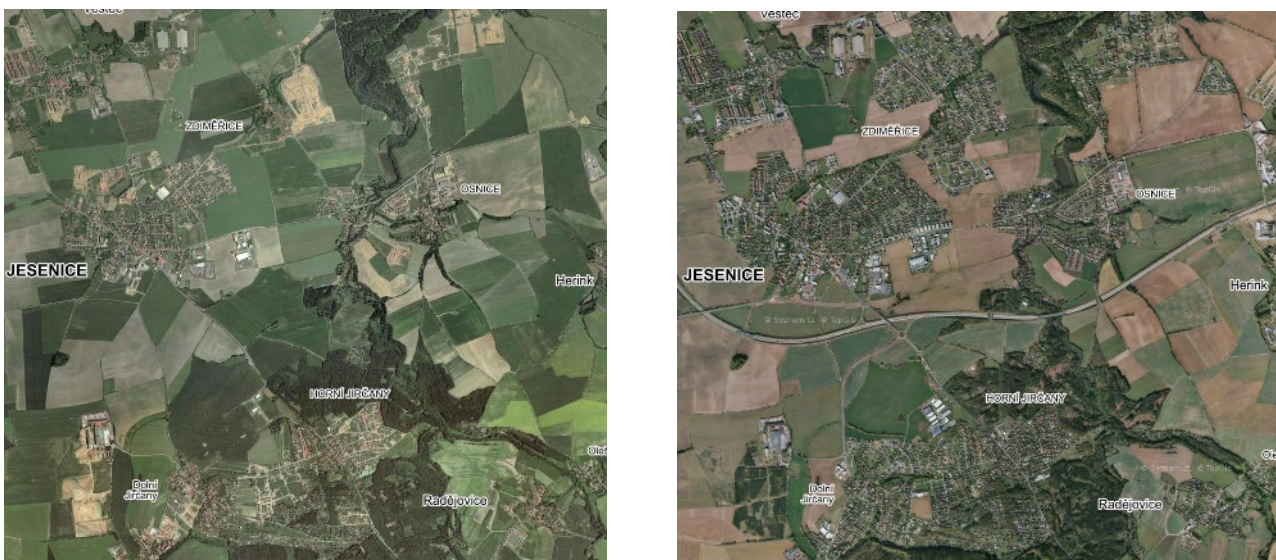
Figure 17.5: Aerial view of Jesenice in 2003 (left) and 2019 (right).

All the mentioned parts of Jesenice have an older historical core, which is gradually followed by buildings from the socialist period. Family houses predominate, supplemented to a limited extent by apartment buildings and agricultural, production, or storage areas. It is also possible to find some recreational cottage buildings in the Botič valley. From the second half of the 1990s to the present, territorial municipalities have undergone intensive residential development. Between 1991 and 2011, the number of houses in the village increased to 1,938—almost 1,400 houses (approximately 2,500 flats) in 20 years. The construction was dominated by family houses, which complemented other commercial buildings (shopping centres, warehouses, production halls) or technical and social infrastructure. While the urban areas of the individual parts of the village did not follow each other before, today there is a gradual interconnection of their built-up areas (Zévl, Ouředníček, 2021). On the other hand, some peripheral parts of the village are adjacent neighbouring settlements (Dolní Jirčany, Prague - Hrnčíře, Průhonice, Dobřejovice). The large number of new buildings created in the last 25 years and the remoteness of selected parts of the new buildings from the original historic cores testify mainly to the thoughtless and uncoordinated territorial development of the village in its recent history.