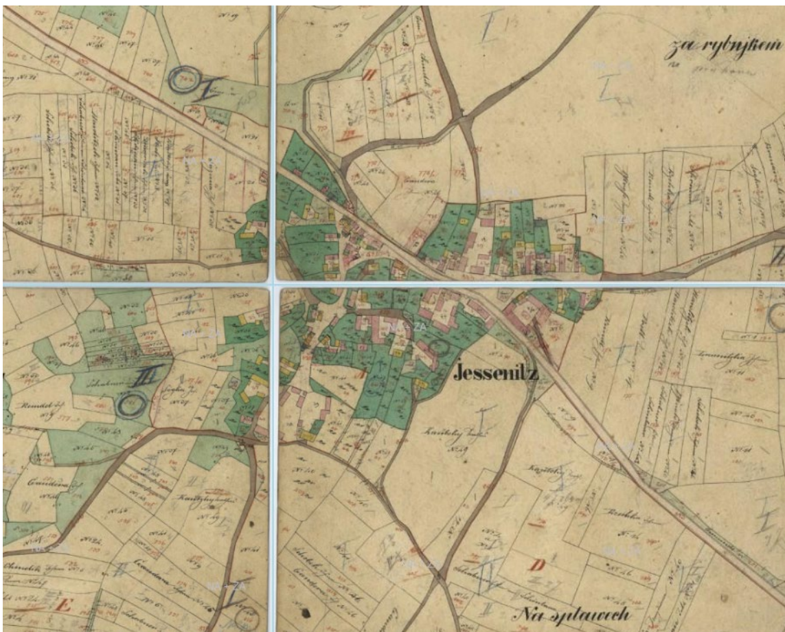
Figure 17.2: Representation of Jesenice in indicator sketches (1841).