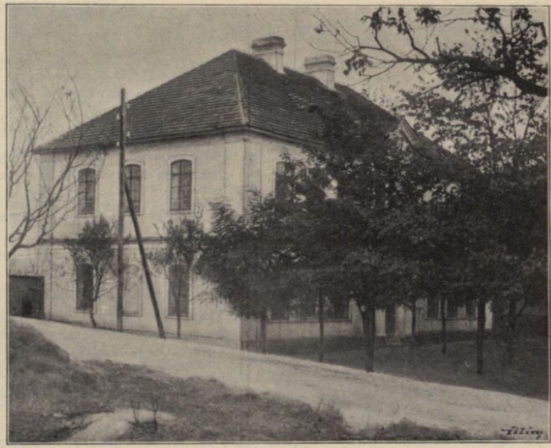
Figure 17.1: Jesenice school in a historical photograph.