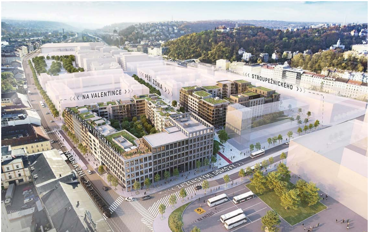
Figure 1.3: Brand new face of Smíchov – Smíchov city complex.

Historical development of the population of Prague and its suburbs in the 19th century, the growth of the oldest suburbs