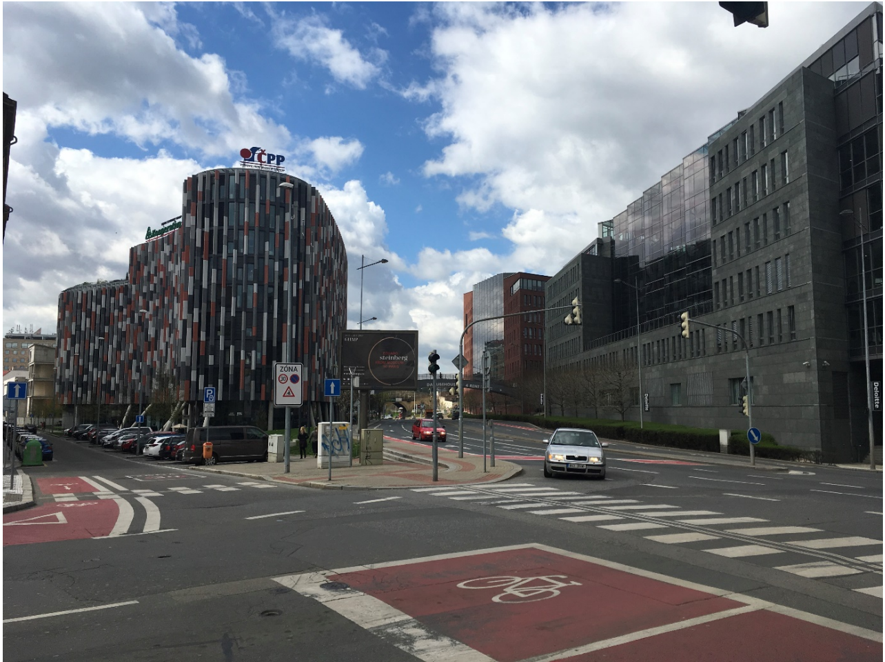
Obrázek 2.2: Postmoderní kancelářské budovy Main Point, část projektu River City v podobě Danube a Nile House.