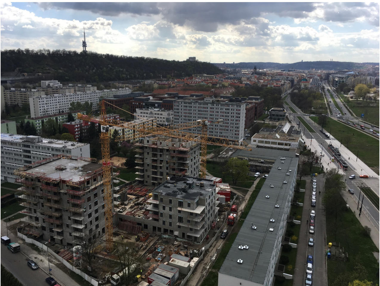
Obrázek 2.4: V jádru sídliště Invalidovna vyrůstá nový rezidenční projekt na místě původní školky, za hotelovým domem kancelářský komplex Futurama, zcela vpravo Pobřežní ulice oddělující nový developerský rozvoj na Rohanském ostrově od starého Karlína.

vnitřní prostorovou polarizaci původního a nového obyvatelstva, původních a nových uživatelů území. Ačkoliv se zřejmě přesně nepodaří rekonstruovat nebo na datech popsat proměnu sociální a demografické struktury Karlína, je zřejmé, že v průběhu popsaného dvěstěletého vývoje jednoho z prvních pražských předměstí došlo k výrazným změnám. Původně rezidenční čtvrť, která byla sociálními geografiy ještě v polovině 20. století řazena mezi nejsilnější pražské oblasti, se v průběhu socialistického období stala sociálně velmi slabou částí metropole, s velmi starou demografickou strukturou a zanedbaným fyzickým stavem bytového fondu. I když komercializace a gentrifikace zřejmě přinesla do území řadu negativních procesů a dopadů, včetně vytlačení části romského obyvatelstva, sociálně slabších a starších obyvatel a výrazného nárůstu cen bydlení, je možné vnímat proměnu fyzické i funkční struktury Karlína spíše jako pozitivní.