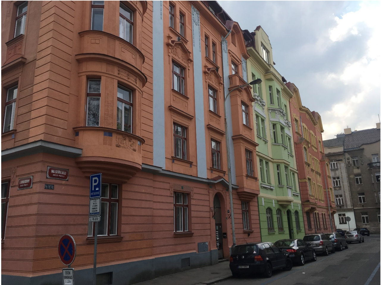
Obrázek 2.3: Secesní zástavba Nového Karlína.