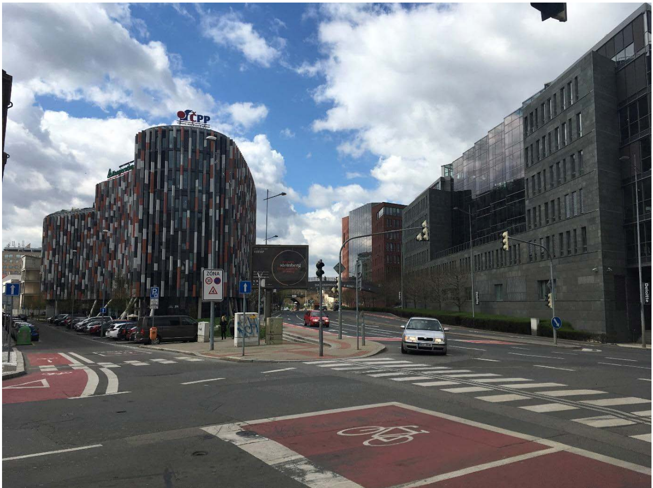
Obrázek 2.2: Postmoderní kancelářské budovy Main Point, část projektu River City v podobě Danube a Nile House.

V popsaném historickém vývoji došlo k vytvoření specifické pražské čtvrti, která je relativně prostorově ohraničena od ostatních částí Prahy (Vltava, Negrelliho viadukt a silnice magistrály, žižkovský Vítkov a železnice) a zároveň ale i silně vnitřně diferencovaná. Pokud bychom generalizovali větší urbanistické celky, můžeme jasně identifikovat starý klasicistní Karlín 19. století s mřížkovou strukturou v západní části území, secesní nový Karlín ze začátku 20. století s dominantní budovou školy na Lyčkově náměstí a řadou zelených ploch, sídliště Invalidovna vybudované jako experiment na začátku 60. let 20. století a nové rezidenční projekty kolem sídliště a území tzv. River City s novými developerskými projekty s rezidenční i komerční funkcí kolem Vltavy (obrázek 2.2).