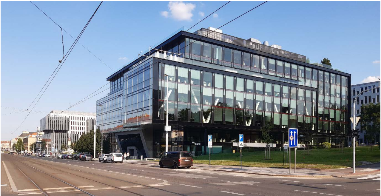
Obrázek 6.2: Administrativní budova PPF Gate na Evropské třídě.