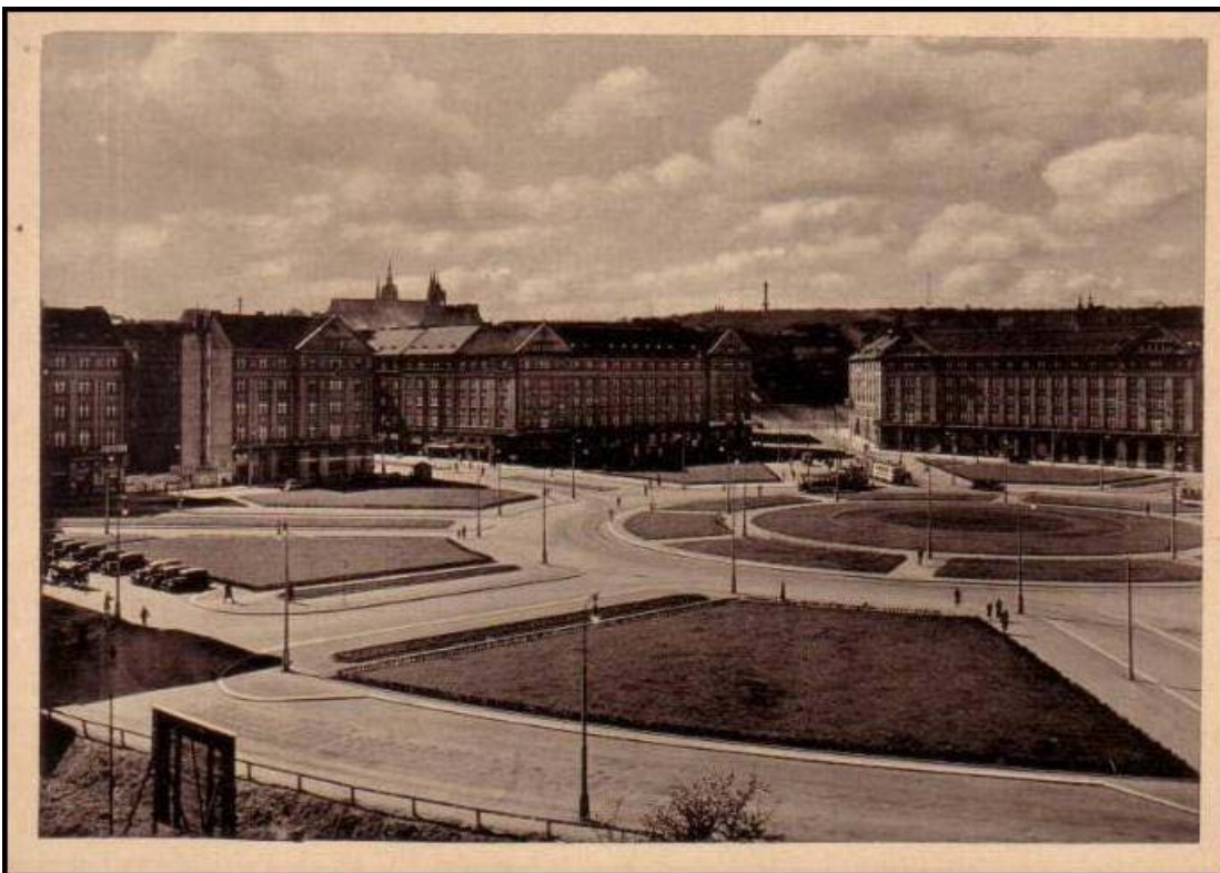
Obrázek 6.1: Vítězné náměstí v roce 1945.

Novým impulzem pro rozvoj Dejvic byl pád komunistického režimu, návrat svobod a opětovné zapojení města do globálních sítí. Strategická poloha městské osy přinesla další nový rozvoj na Evropskou ulici, kde vyrostlo větší množství administrativních a komerčních budov (obrázek 6.2). Některé stavby musely záměrům nových investorů ustoupit, mezi nimi například dejvická telefonní ústředna či kontroverzní a odborníky ceněný hotel Praha. Developeři využili dispozic Šáreckého údolí pro výstavbu luxusních areálů rodinných domů, zcela nový kompaktní areál bytových domů potom vyrostl na místě bývalé sladovny na Podbabě.