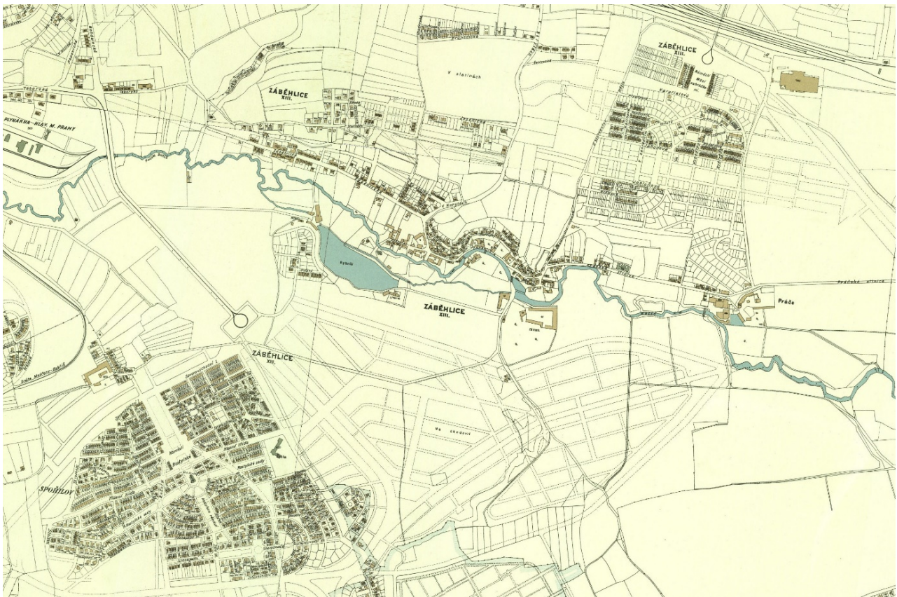
Obrázek 7.1: Charakteristická zástavba dvou nově vybudovaných zahradních měst Spořilov (jihovýchodně) a Zahradní Město (v severní části) s konečnými zastávkami tramvaje.

Druhým relativně ambiciózním plánem byl projekt Zahradního Města částečně realizovaný v pozdějším období let 1935–1941 opět pro střední úředníky pracující v Praze. Na obrázku 7.1 stojí za povšimnutí jeden z nejdůležitějších atributů tehdejší suburbánní výstavby, a to konečné zastávky tramvaje. V případě Spořilova byla tramvajová doprava zavedena až jako reakce na nedostatečné autobusové spojení nové čtvrti s Prahou, Zahradní Město naopak prezentovalo nové tramvajové spojení jako jednu z hlavních výhod vzdáleného, ale rychle dostupného bydlení za Prahou (Praha neznámá, 2020). Zajímavým aspektem rozvoje Zahradního Města byl rovněž důraz na zdravý životní styl včetně široké nabídky sportovního vyžití v novém suburbu (kuželky, tenis). U obou zahradních měst stojí za pozornost také označování ulic. Zatímco Spořilov v názvech ulic nezapře inspiraci klasickými anglickými předměstskými sídly a snaží se při orientaci v území využít názvů světových stran, Zahradní Město je tvořeno ulicemi nazvanými podle květin a stromů. Tento přístup se v současnosti opakuje v mnoha suburbánních obcích v zázemí města.