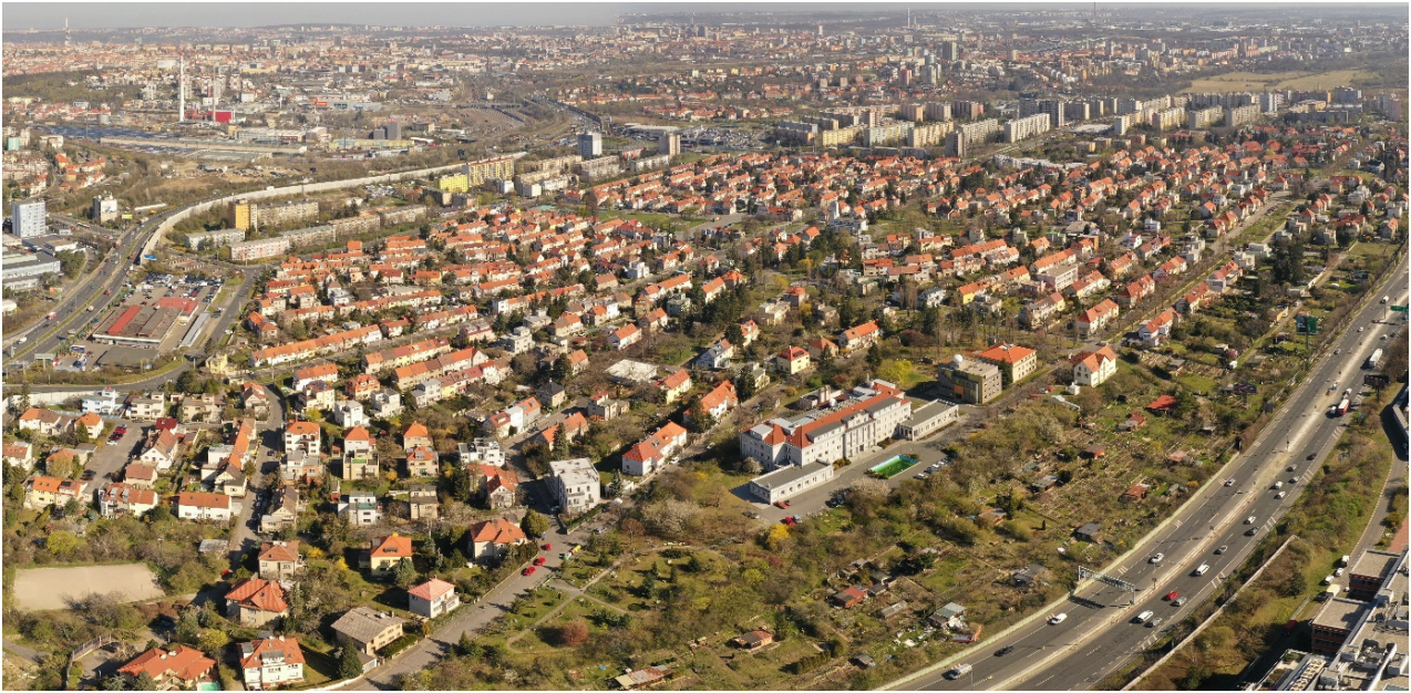
Obrázek 7.3: Současná podoba Spořilova.