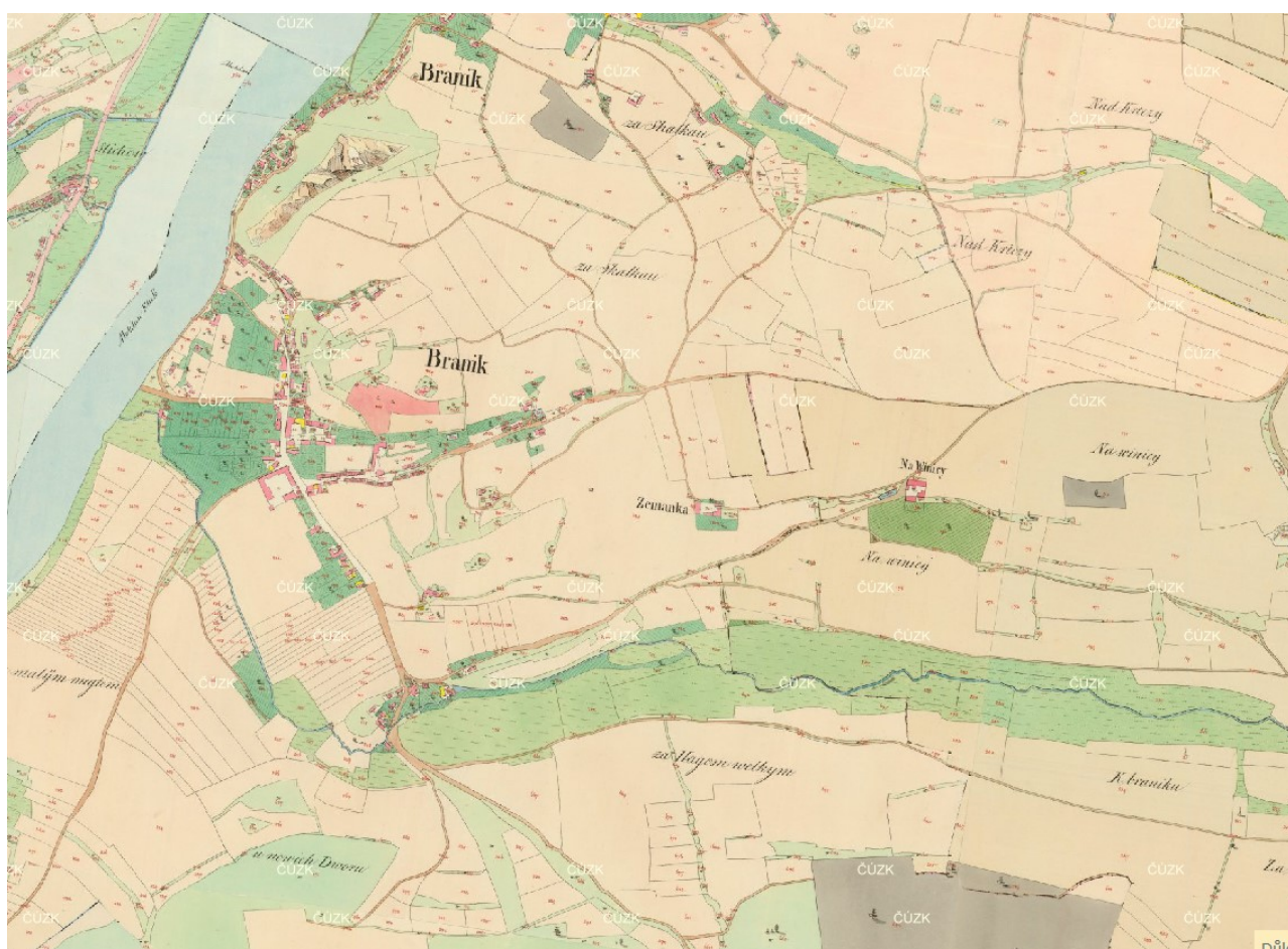
Obrázek 8.1: Císařské otisky stabilního katastru z roku 1843 s výřezem zobrazujícím území Braníka.

V období pořízení císařských otisků stabilního katastru (obrázek 8.1) žilo na území Braníka 858 osob a stálo 124 domů. První novodobý strmý nárůst počtu obyvatel je spjat se vznikem tzv. Velké Prahy a připojení Braníka k hlavnímu městu. Původní struktura venkovské zástavby obce zůstala zachována především podél Branické ulice. Pozůstatky vinic a zemědělských usedlostí se dodnes dochovaly v podobě usedlosti Zemanka a neorenesanční stavby v ulici Na Křížku, jež na počátku 20. století sloužila jako výletní restaurace. Na venkovskou zástavbu postupně navázala výstavba činžovních domů, které je možné najít především v okolí Krčské ulice, a vilová zástavba. Rozvoj vilové zástavby probíhal jak na svazích, tak i na plošinách obou kopců spadajících do branického katastru.