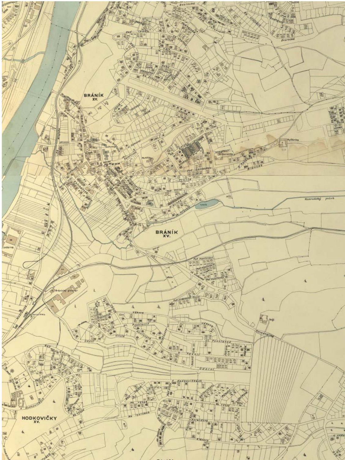
Obrázek 8.2: Orientační plán hlavního města Prahy s okolím z roku 1938 s výřezem zobrazujícím území Bráníka.