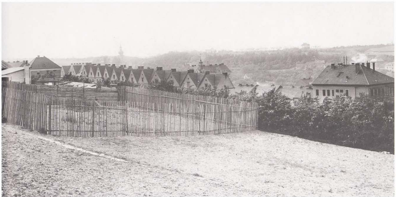
Obrázek 9.3: Pohled na řadu činžovních domů v ulici 8. listopadu.

v cihelnách a v tradiční řemeslné kovovýrobě (Moravcová, 1978). Poměrně vysoký podíl dělnického obyvatelstva činného v průmyslu, obchodu a dopravě tak lze vnímat jako signál začínající proměny původně venkovského charakteru tohoto bývalého předměstí. Ke konci 19. století se začaly tyto sociální proměny projevovat také ve fyzickém prostředí břevnovského území, postupně začaly přibývat domy městského charakteru. Bělová a Kalašová (2016) uvádějí, že pro „staré Břevnováky“ byly typické sousedské vztahy vesnického charakteru, včetně samozřejmé sousedské výpomoci. Tito starousedlíci pak přijímali nově příchozí obyvatele, kteří se usazovali v nově postavených činžovních domech, s nedůvěrou. Nicméně svůj zemědělský ráz Břevnov zcela neztratil ani v následujících desetiletích. Jiří Král (1947) zařadil Břevnov mezi území typu „obytná a zemědělská periferie v přerodu, místy s průmyslem“.