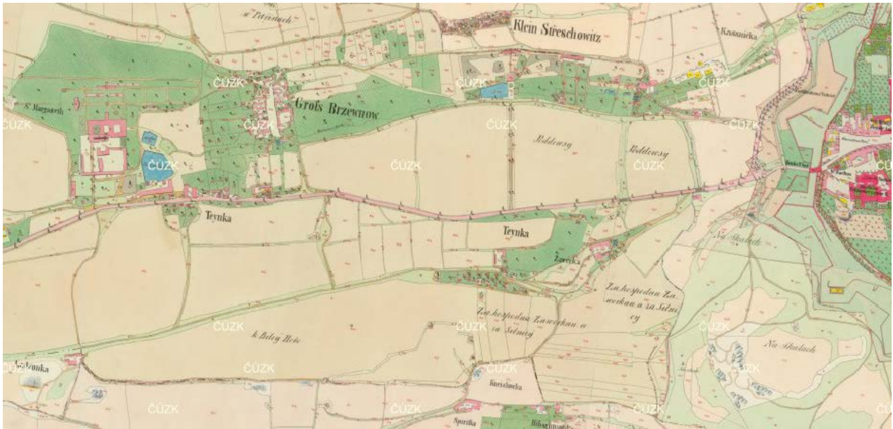
Obrázek 9.2: Mapa stabilního katastru z roku 1843 s výřezem zobrazujícím území Velkého Břevnova, Tejnky a historického území „Na skalách“ (nyní Strahov).

Historický vývoj obyvatelstva Prahy a jejích předměstí v první polovině 20. století, rezidenční a průmyslová předměstí