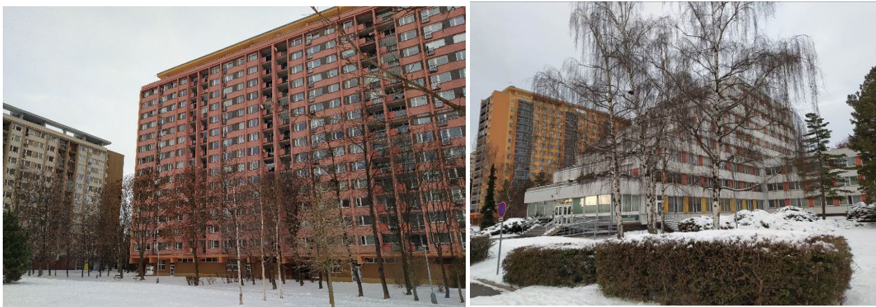
Obrázek 12.2: Sídliště Dáblice: velké deskové a terasové panelové domy.