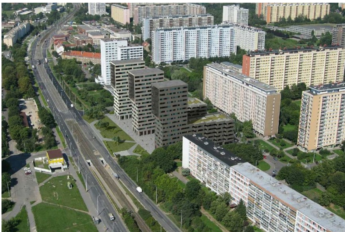
Obrázek 12.3: Jedna z variant plánovaného developerského projektu CPI výstavby na území sídliště Ďáblice.

V období po roce 1989 již k další významné výstavbě nedocházelo. V poslední době je však prostor sídliště pod velkým tlakem developerů. Ti se snaží postavit nové projekty ve volných prostranstvích a také místo nízkopodlažních objektů občanské vybavenosti (Švácha, 2019). Řada odborníků proto míní, že by sídlíště mělo mít památkovou ochranu (Řepková, 2015).