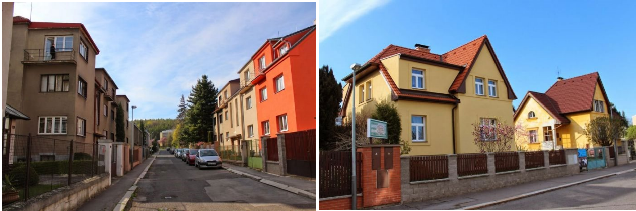
Obrázek 12.1: Seidlova kolonie.

na konci 40. let postaveno menší, tzv. dvouletkové sídliště Kobyličky I (v okolí ulice Horňátecká). Zvolený řádkový způsob zástavby respektoval předválečnou regulaci. Zajímavé je, že v 80. letech pak byly domy doplněny mansardovými nástavbami (Tuček, 2019).