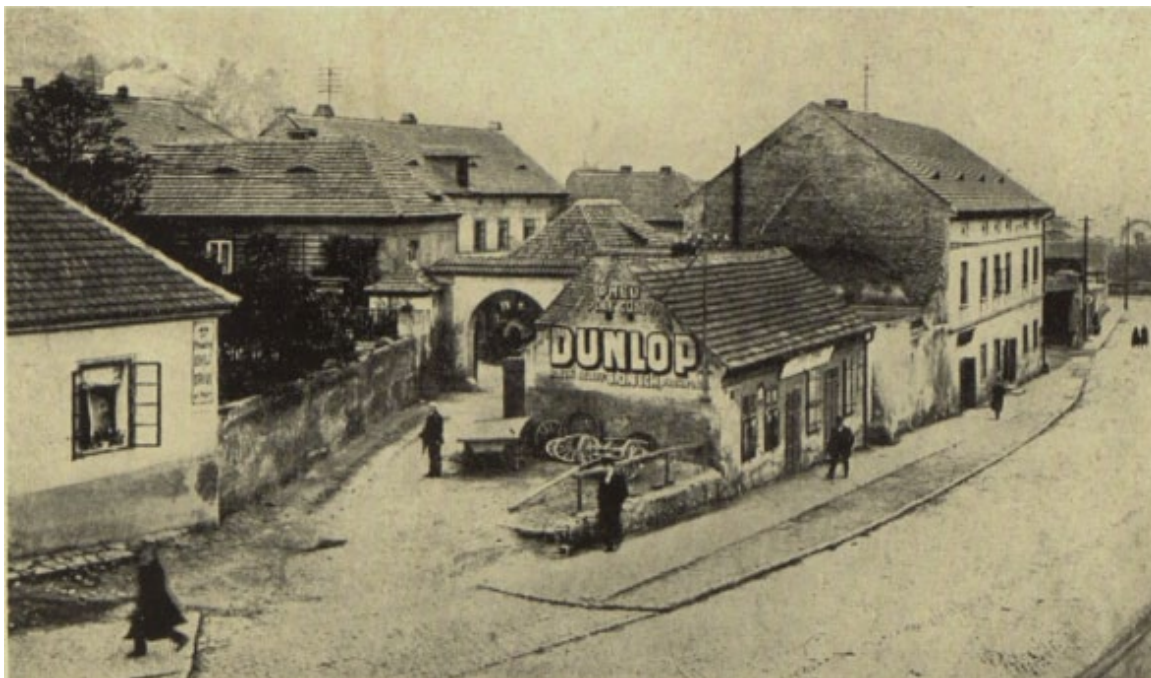
Obrázek 13.2: Zlíchov na počátku 20. století.