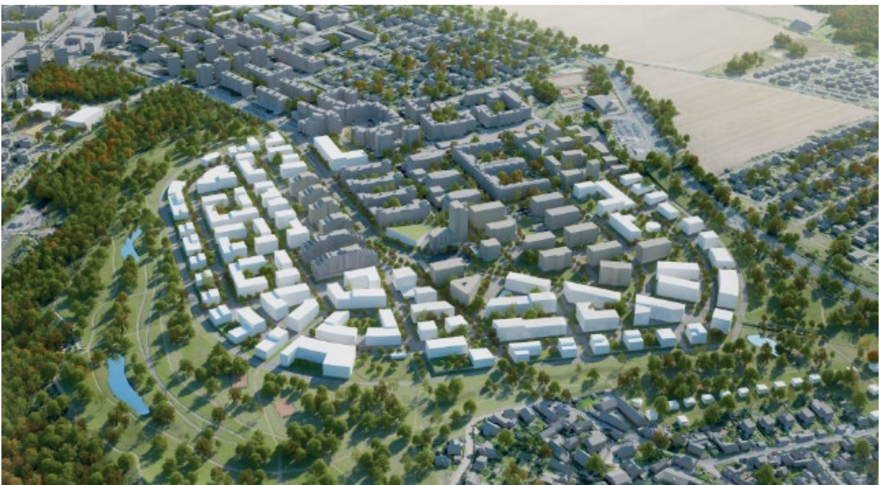
Obrázek 13.5: Návrh budoucího zastavění západní části sídliště Nový Barrandov.