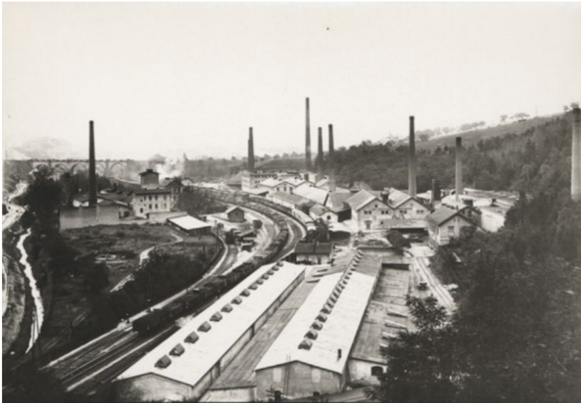
Obrázek 13.1: Staré Hlubočepy kolem roku 1925.