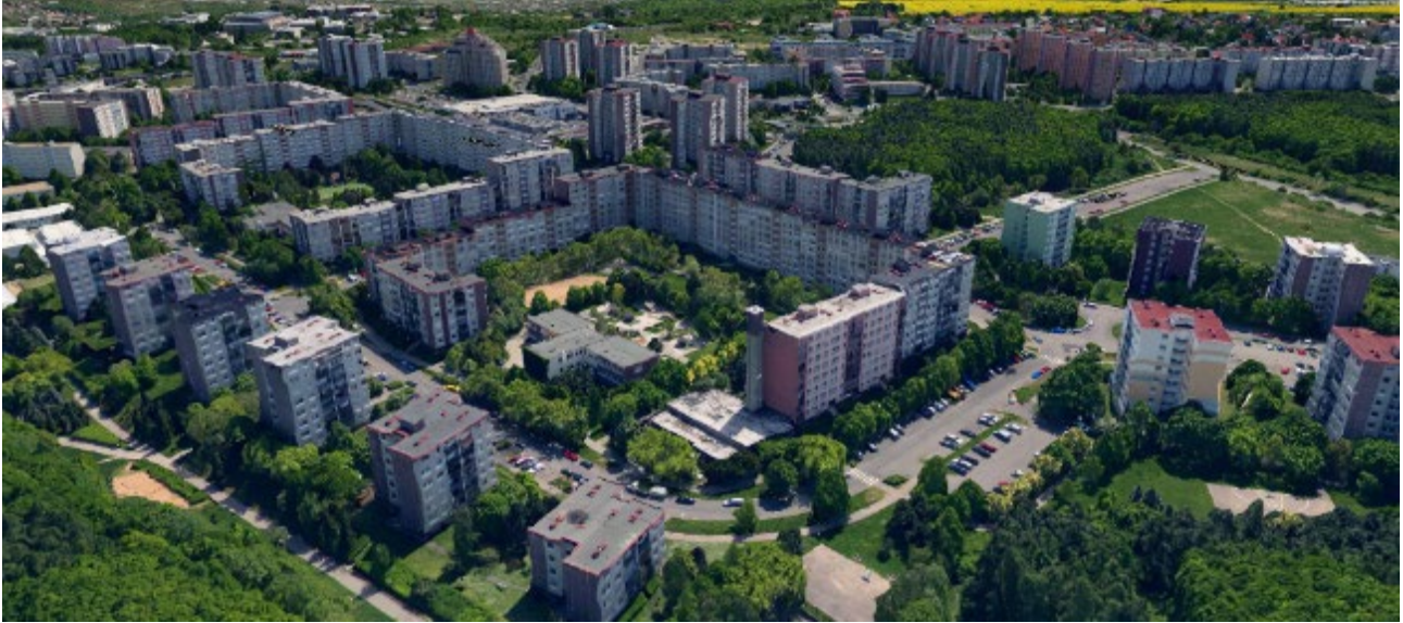
Obrázek 13.4: Sídliště Nový Barrandov v současnosti.