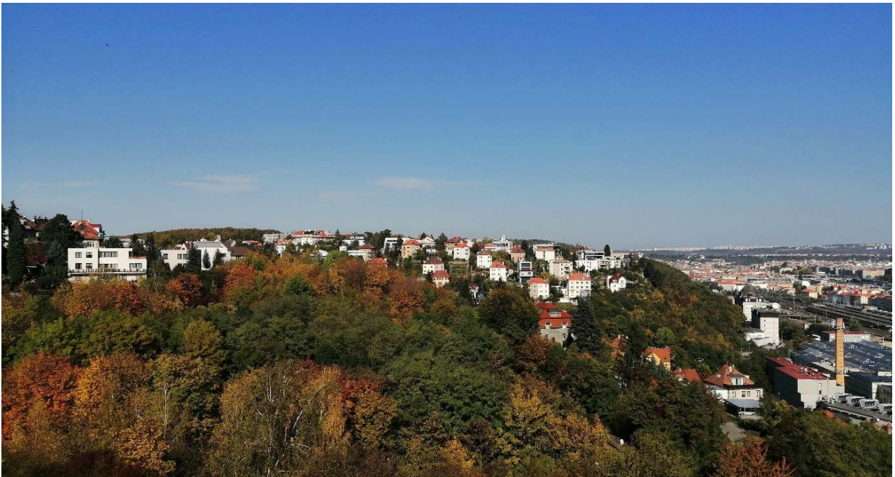
Obrázek 1.2: Vilová zástavba na Kesnerce.

Zcela novou kapitolu v historii Smíchova posléze otevřela sametová revoluce, která v podmínkách znovuobnovené tržní, politické i společenské svobody umožnila rozsáhlou proměnu postupně deindustrializované čtvrti. Nejvýraznější transformací prošla oblast kolem stanice metra Anděl, kde vyrostlo nové obchodně-administrativní srdce čtvrti s celoměstským významem (Temelová, Novák, 2007) – již Ctibor Votrubec (1965) zmiňuje křižovatku u Anděla jako jednu z nejušnějších v celém městě a dnes toto tvrzení platí snad ještě více. V blízké době by měla na rozvoj lokality navázat výstavba zcela nového areálu Smíchov City (obrázek 1.3), která bude zatím vůbec nejvýraznějším otiskem postmoderní éry.