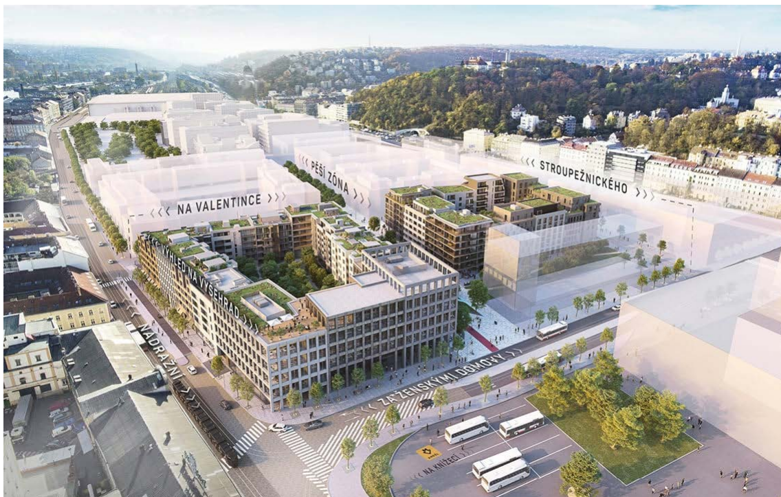
Obrázek 1.3: Nová tvář Smíchova – Smíchov City.