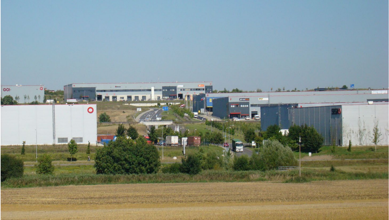
Figure 20.5: Logistics park in Hostivice.