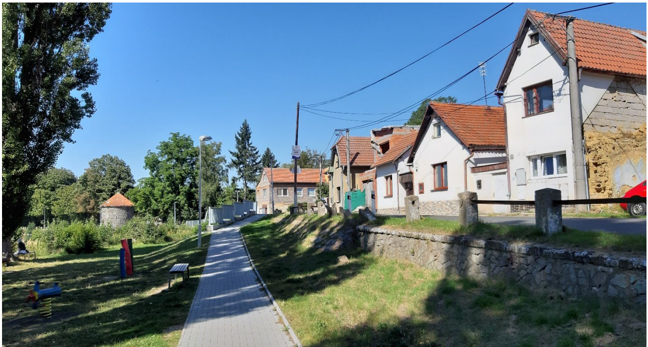
Figure 20.7: Retaining the character of a rural settlement despite being a neighbourhood within the metropolis.

Although the year 1991 meant a quantitative shift in education and in a higher share of employees, the internal spatial inequalities between the individual parts of Hostivice remain similar. The latest available data on education is from 2011 and therefore does not fully reflect the ongoing suburbanisation. Despite a significant increase in the share of university and high school students in the Hostivice population, it still does not reach the values of the youngest Prague housing estates (e.g., Barrandov). Due to significant construction on the weaker, western edge of Hostivice, the spatial pattern representing higher social status changed in favour of Litovice.