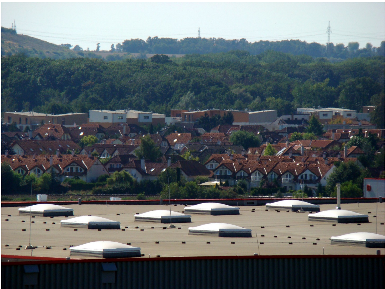
Figure 20.2: Suburbanization in Hostivice.