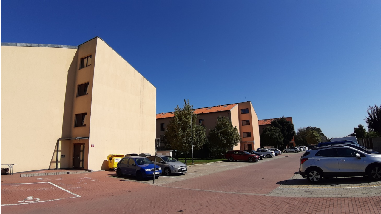
Figure 20.4: Housing cooperative construction in Za Mlýnem Street.