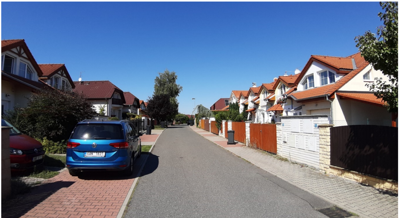
Figure 20.3: Suburban construction on Jasanová Street consisting of standardised terraced and detached houses.

There is an interesting story behind the construction of the new housing units in Hostivice (Figure 20.4). The first project was created in 1997 as a cooperative housing for students and teachers of architecture at the Czech Technical University (ČVUT), who acquired land from Hostivice in exchange for 13 of 63 built apartments to the municipality (Richter, 2018). In the following years, the initiators of the cooperative construction founded a company that specialised in the construction of collective housing—again, mainly in Hostivice. Using resources from the Ministry of Regional Development of the Czech Republic, the State Housing Development Fund, and the city of Hostivice, five projects with a total of 540 flats were created, which is more than half of the flats built between 1991 and 2011 (Doma, 2021). The partial financing of these projects by the city is linked to temporary control over the share in housing cooperatives and, thus, to better possibilities of influencing the housing policy in Hostivice.