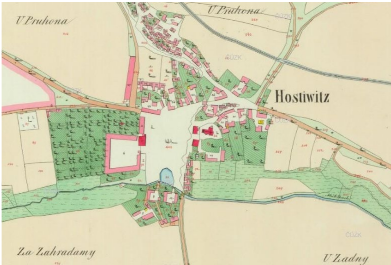
Figure 20.1: Hostivice on the map of the Stable cadastre (1842).

associated with the socialist period, although to a very limited extent. The individual development filling the First Republic district on the border of Litovice and Hostivice, as well as the Na Pískách housing estate from the 1960s, was promoted. Other family houses were built under the banner of the local collective farm. During the twentieth and twenty-first centuries, Litovice and Hostivice were physically connected. On the other hand, Břve has changed only slightly in the last 120 years, albeit the unfulfilled plans were to transform the surrounding fields into lucrative addresses (Balvín 2012).