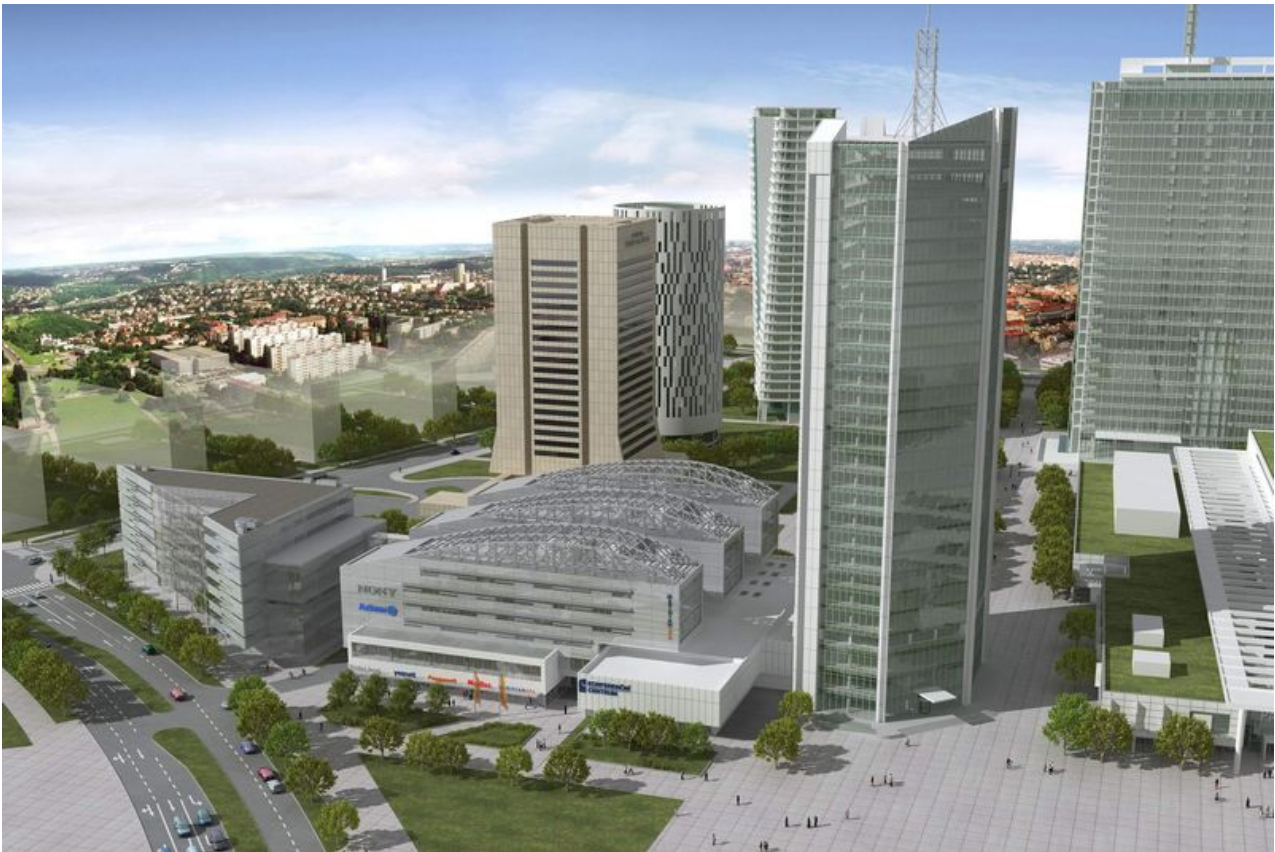
Obrázek 5.2: Vizualizace projektu budovy City Empiria architekta Václava Aulického.

Historický vývoj obyvatelstva Prahy a jejích předměstí v první polovině 20. století, rezidenční a průmyslová předměstí